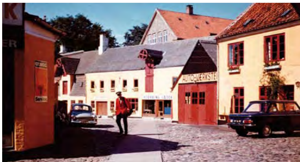
Penderups Gård midt i 70'erne.