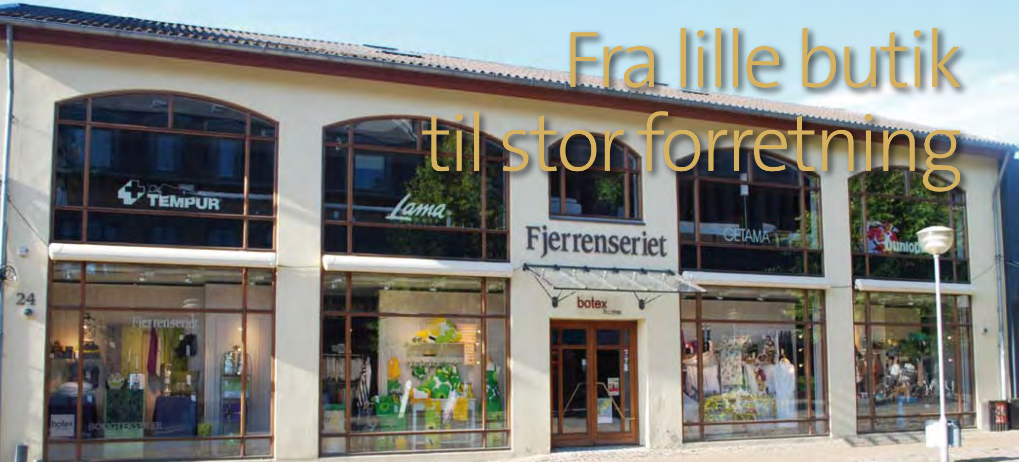
Fjerrenseriet anno 2009.

Fjerrenseriet er gennem årene blevet ombygget og moderniseret adskillige gange, og egentlig var det et rent tilfælde, at forretningen kom til at ligge, hvor den ligger i dag.