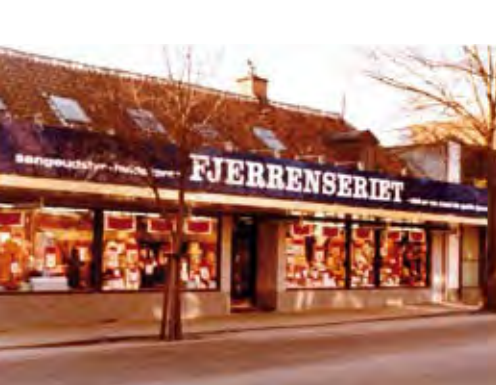
Fjerrenseriet anno 1972.